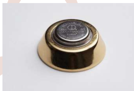
Socle métal ANTI-VANDALE